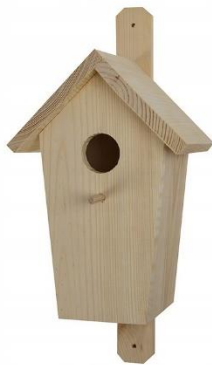
Budka dla ptaków

Rodzic wyjaśnia niezrozumiałe zwroty i słowa, np. mrok, gąszcz, bruzda, okap, wrota, budka szpaka. Zadaje pytania: Jakie ptaki rozmawiały ze sobą? W jakich miejscach budowały swoje gniazda? A gdzie wróbel buduje gniazdo? Dlaczego powinniśmy dbać o ptaki? Jak możemy im pomagać? Bardzo proszę zwrócić uwagę, że ptaki w miastach, a zwłaszcza szpaki, korzystają z budek lęgowych wykonanych i zawieszonych przez człowieka. Rodzic demonstruje zdjęcie budki. Dzieci wskazują różnice i podobieństwa pomiędzy budką a gniazdami. Mają przed sobą zdjęcia ptaków występujących w opowiadaniu wraz z podpisami oraz zdjęcia ich gniazd także z podpisami: gniazdo dzięcioła, gniazdo skowronka, gniazdo jaskółki, gniazdo remiza, gniazdo szpaka, gniazdo bociana. Wymieniają ptaki budujące gniazda na górze – na drzewach (słupach) lub pod dachem, i te, które budują na dole – w trawie, w sitowiu, niskich krzakach