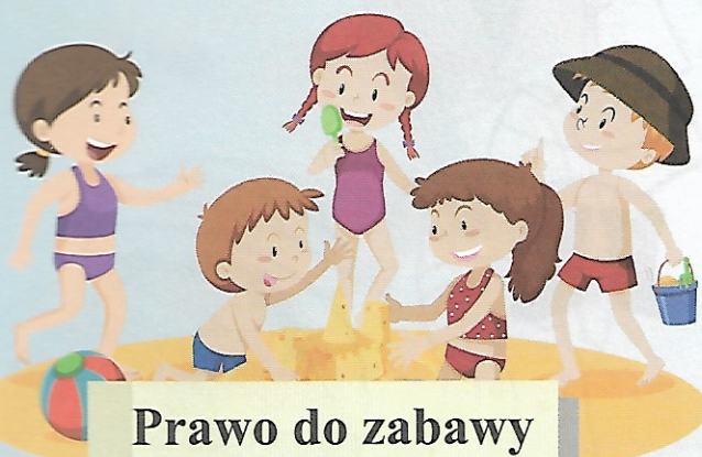
Prawo do zabawy i odpoczynku