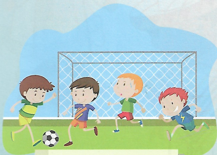
Prawo do rozwoju fizycznego