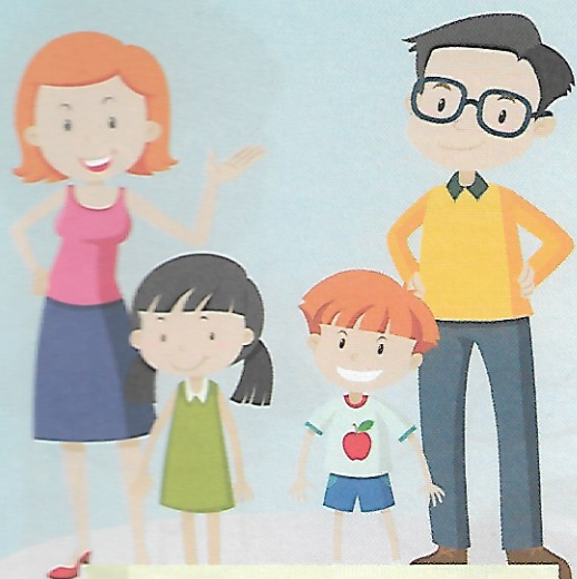
Prawo do życia w rodzinie