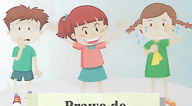
Prawo do wyrażania emocji