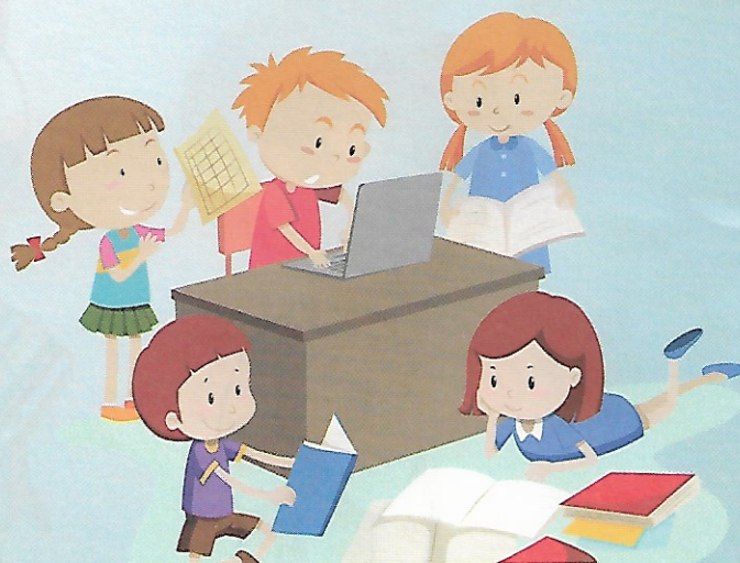
Prawo do nauki